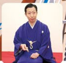
古今亭菊之丞 - 落語家

1991年に二代目古今亭圓菊に入門し、2003年に真打ち昇進。2013年に芸術選奨文部科学大臣賞新人賞を受賞。