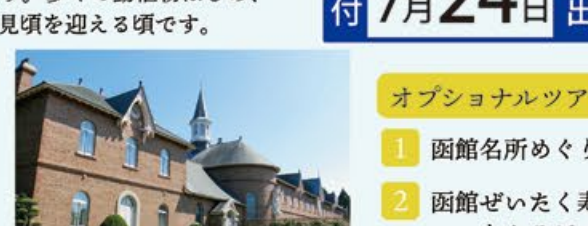
函館山ロープウェイ 山麓駅と山頂駅を結ぶ空の道。崖壁から路面電車を乗っても良い距離 五稜郭 国の特別史跡に指定される星形の城郭。箱館戦争の舞台でも有名 トラピスチヌ修道院 1898年に創建された女性修道院。今でも60人ほどの修道女が在籍