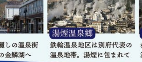
湯布院 山に抱かれた麗しの温泉街 由布岳たとの金鱗湖へ 湯煙温泉郷 鉄輪温泉地区は別府代表の温泉地帯。湯煙に包まれて 地獄めぐり 赤い血の池地獄、ブルーの海地獄等まさに泉質の宝庫

「湯 and YOU! 懐かしい温泉の香りと湯煙に誘われて。」 日本三大名湯として名高い別府温泉郷。につぼ丸が着岸する岸壁からは湯煙がご覧いただけます。足を伸ばせば別府の奥座敷、湯布院での贅沢なひとときも待っています。