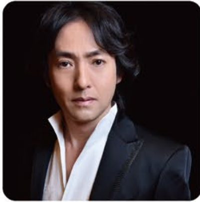
秋川雅史 - テノール歌手

1998年、カンツォーネコンクール第1位。2006年、第57回NHK紅白歌合戦に初出場。2007年、シングル「千の風になって」でクラシックの歌手として史上初のオリコンシングルチャート1位を獲得。2021年から二科展で3年連続の入選。現在、歌手と彫刻家の二刀流で活躍している。