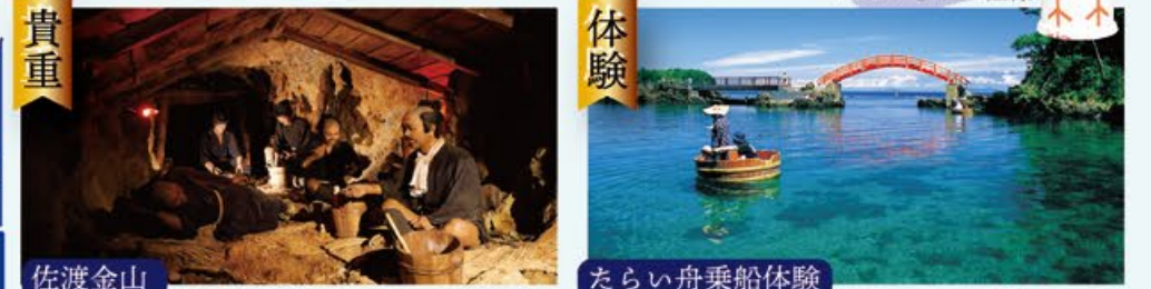
貴重 佐渡金山 四百年の歴史を伝える史跡。世界最高品質の金を生産した世界的にも類をみない洞窟。 体験 たらい舟乗船体験 佐渡の風景に似合うタライ。洗濯桶から生まれたと言われ、刺激的な体験になるはず。