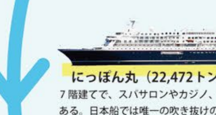
にっぽん丸 (22,472トン/全長166m) 7階建てで、スパサロンやカジノ、ダンスホールなどがある。日本船では唯一の吹き抜けのメインホールを完備

今回お届けするのはクルーズに興味を持ったことのある人なら、「一度は乗ってみたい」と憧れる日本一周クルーズです。島国の日本は当然海にぐるりと囲まれており船旅は最適な旅行方法のひとつ。ゆったりとした時間を過ごしながら日本の情緒ある港、全国の風情を再発見できるのが日本一周クルーズの醍醐味。