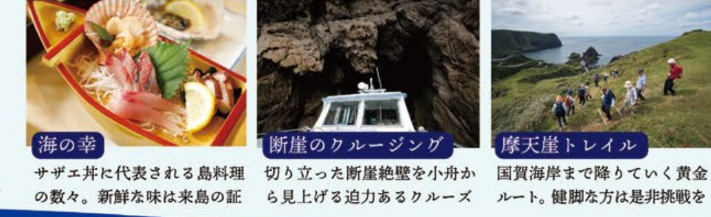
海の幸 サザエ井に代表される島料理の数々。新鮮な味は来島の証 断崖のクルージング 切り立った断崖絶壁を小舟から見上げる迫力あるクルーズ 摩天崖トレイル 国賀海岸まで降りていく黄金ルート。健脚の方は是非挑戦を