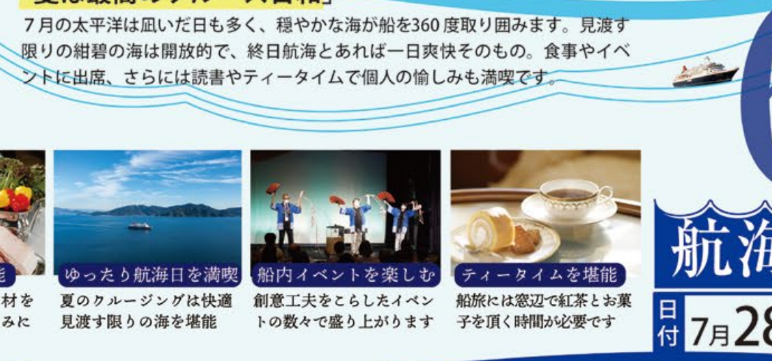
船上サービス 船上では人気のゴディバ ショコリキサー 洋上グルメを堪能 日本各地の旬の食材を使った料理をお楽しみ ゆったり航海日を満喫 夏のクルージングは快適 見渡す限りの海を堪能 船内イベントを楽しむ 創意工夫をこらしたイベントの数々が盛り上がり ティータイムを堪能 船旅には窓辺で紅茶とお菓子を頂く時間が必要です