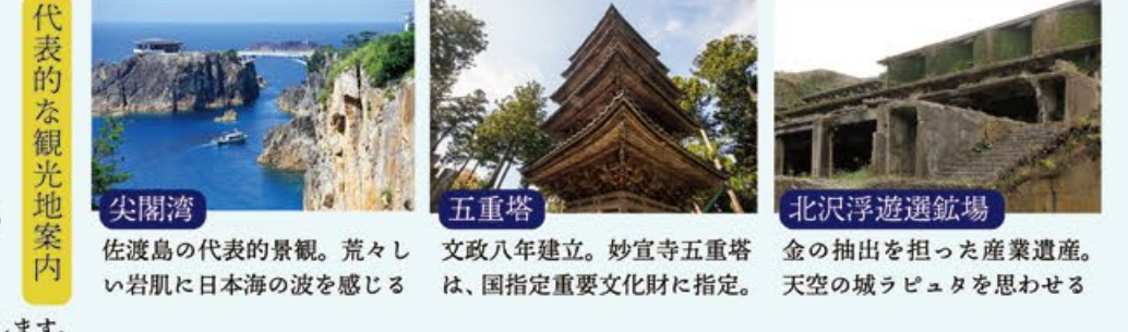
代表的な観光地案内 尖閣湾 佐渡島の代表的景観。荒々しい岩肌と日本海の波を感じる。 五重塔 文政八年建立。妙宣寺五重塔は、国指定重要文化財に指定。 北沢浮遊選鉱場 金の抽出を担った産業遺産。天空の城ラピュタを思わせる。