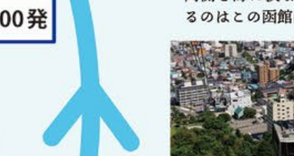
函館山展望台 函館のシンボルとして一度は訪れたい名所。両側を海に挟まれた珍しい地形を一望できるのはこの函館山の展望台だけ。

「かもめ鳴けば船旅のはじまり。海に挟まれた旅情の街並み」 活気ある漁港や朝市、その奥の山手には異国情緒あふれる建築群があり、和の文化と洋の文化が混ざり合う他の北海道の都市とは少し違った趣を持つ街。そんな港町には船がよく似合う。さあ、港から始まる最初の寄港地へ。