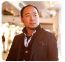
中村風詩人 - 写真家

京都府出身。第一回東京声楽コンクール第1位および審査員長賞受賞。『魔笛』夜の女王役で東京デビュー。