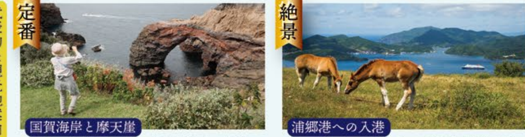
定番 国賀海岸と摩天崖 隠岐の島を訪れたら一度は行きたい場所。野生の牛や馬が道を闊歩する景色は異世界そのもの、国賀海岸まで絶景ハイキングを。 絶景 浦郷港への入港 につぼ丸で行くからこそ見える景色がある。7階のデッキから見る入港シーンは絶景、両側に迫る島々の迫りに圧倒される。